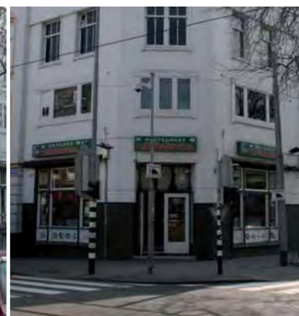
Na toepassing van de nieuwe reclameregels