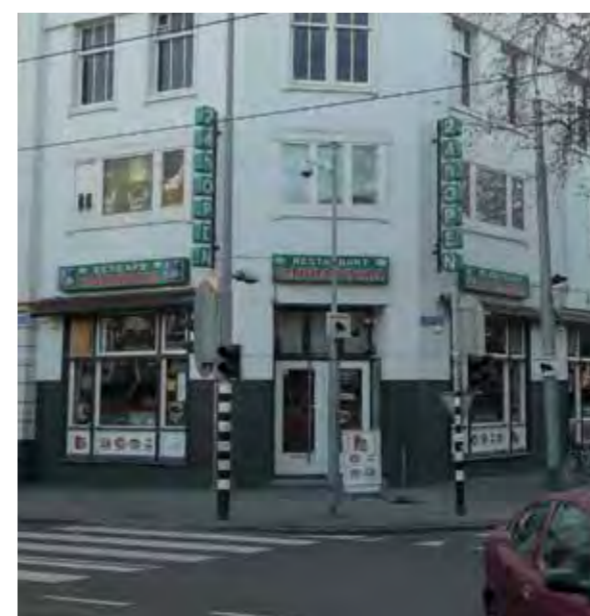
Voor toepassing van de nieuwe reclameregels

verzoek van bewoners zijn de reclame-uitingen onder de loep genomen. Waar de reclames niet voldeden aan de regels, is de ondernemer hierop aangesproken en zijn de uitingen aangepast. De laatste drie ondernemers zijn al bezig of starten binnenkort met het vervangen van de oude reclames. Het resultaat: een veel rustiger en aantrekkelijker beeld.